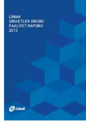
Limak Faaliyet Raporu, 2013

SÜRDÜRÜLEBİLİR BÜYÜME, SÜRDÜRÜLEBİLİR İLETİŞİM