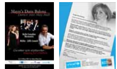
Unicef gazete ilanlarından