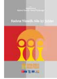
Kadına Yönelik Aile İçi Şiddetle Mücadele yayınlarından

Kreatif Direktör, Tasarımcı 1974 GSM: 0 532 523 35 74 senem@argosreklam.com