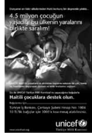
UNICEF Bağış ilanlarından