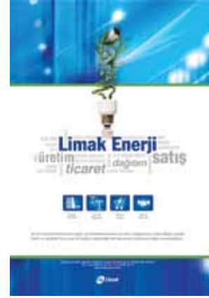
Limak Enerji katalog